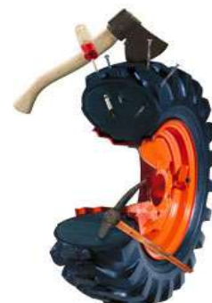
Tato situace s plněním Rely® nemůže nastat